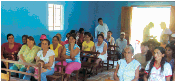
En la reunión se presentaron prioridades de gestión de la Secretaría de la Mujer a favor de mujeres del Departamento.

Participaron secretarías de las municipalidades de los distritos de Itapúa, policías, sindicato de periodistas, área salud y funcionarios/as de la municipalidad de Encarnación.