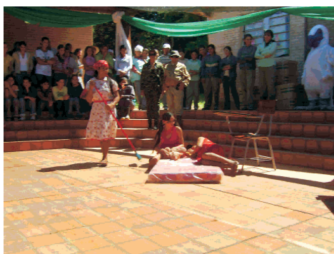
Mujeres organizadas del departamento de Canindeyú ofrecieron una representación teatral a las/os asistentes a la presentación del proyecto.