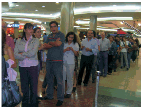
Numerosas personas asistieron al pre estreno de la película Preciosa.

La adolescente Claireece "Preciosa" Jones tiene 16 años, es obesa y analfabeta y espera su segundo hijo de su propio padre ausente. Vive en Harlem, el reino de los invisibles, de los sin voz, con su madre, una reclusa cruel que mira la televisión sin cesar y la somete a los más denigrantes abusos. Forzada a abandonar la escuela a causa de su embarazo, Preciosa acaba en un instituto para casos desesperados. Y allí, en el último escalón de aquellos que ya han bajado todas las escaleras, está la señorita Rain, una maestra joven, combativa y radical a través de la cual Preciosa tendrá la posibilidad de recuperar su voz y su dignidad descubriendo un nuevo mundo en el que puede al fin expresarse de una manera que nunca antes había imaginado.