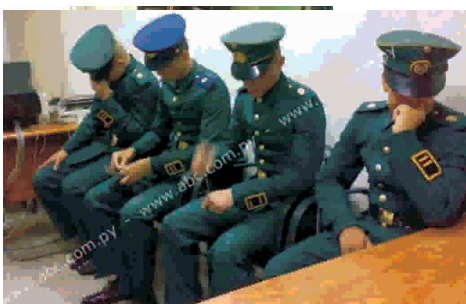
Cadetes imputados.