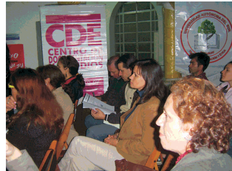
Participantes de la presentación de informe del Observatorio de Comunicación

Por la semana del/la Periodista, el Observatorio de Comunicación fue invitado para compartir con la audiencia de Radio Viva