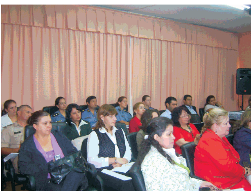
Representantes de Argentina, Brasil y Paraguay participaron de la segunda reunión del Comité.

Cabe recordar que por la Secretaría de la Mujer de la Presidencia de la República del Paraguay, la ministra Gloria Rubin suscribió un Memorandum de Entendimiento entre la Sub Secretaría de la Mujer del Ministerio de Relaciones Exteriores, Comercio Internacional y Culto de la República Argentina y la Secretaría Especial de Políticas para las Mujeres de la Presidencia de la República Federativa del Brasil.