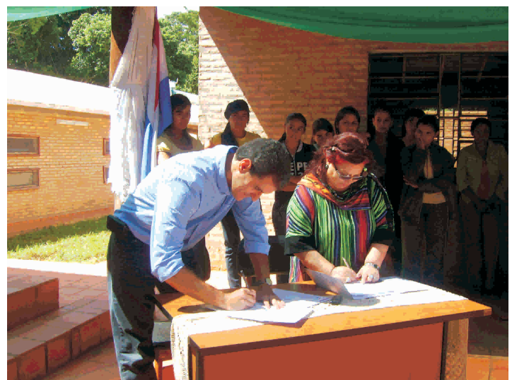
El representante de la Fundación Moisés Bertoni y la ministra Rubin, durante la suscripción.