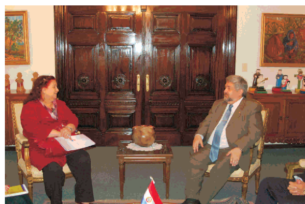
La ministra de la Mujer, Gloria Rubín en conversación con el Canciller Nacional, Héctor Lacognata.