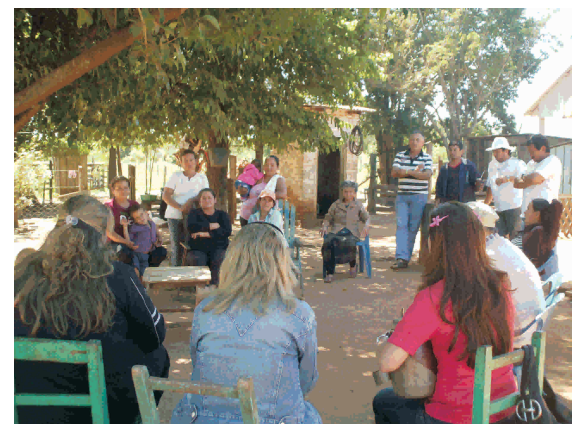
Representantes de la Secretaría de la Mujer en reunión con las mujeres de Caazapá.

Los resultados obtenidos son la visibilidad de la Secretaría de la Mujer de la Presidencia y del Proyecto "Asistencia en políticas de participación de la mujer para el desarrollo rural y la seguridad alimentaria en Paraguay"; Contacto con grupos de mujeres organizadas en el Departamento de Caazapá; Coordinación de acciones entre la SMPR y las oficinas de la DEAG en el Departamento y las Acciones conjuntas entre la SMPR, DEAG y ACH.