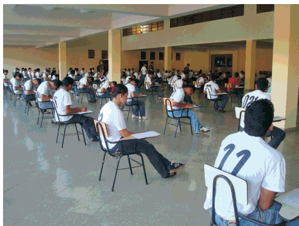
Foto ilustración: Aspirantes a la ACADEMIL, durante el último examen de ingreso.

La equidad de género y el igual acceso a oportunidades debe ser la piedra angular de unas fuerzas armadas modernas y plenamente incorporadas a las reglas del estado de derecho y los derechos humanos.